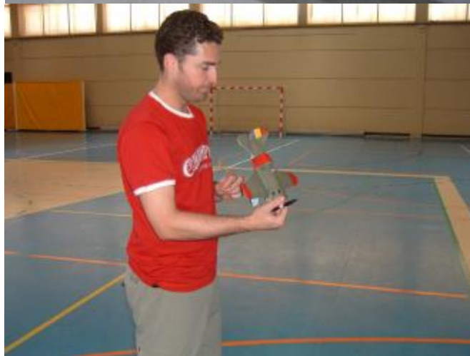
Imagen de alguna de las maravillas que nos deleitaron durante la competición.